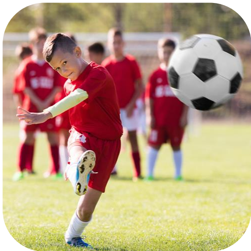
Sport z. B. Sportstiftung

„Wir fördern die Menschen in unsere Region – z. B. durch unsere 13 Stiftungen.“