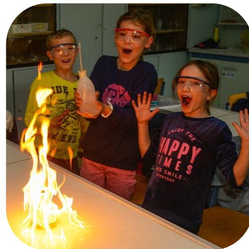
Jugend z. B. Hochbegabten-Stiftung