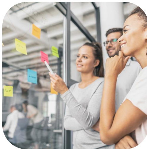
Existenzgründungen / Start-Ups