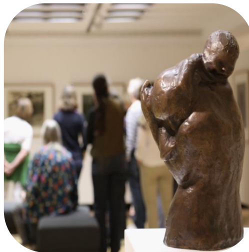
Kultur z. B. Käthe Kollwitz Museum